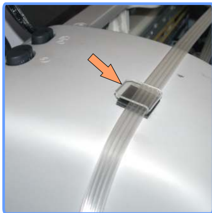
Вывод шлейфа C43

Установите клипсу с левой стороны аппарата, и выведите через неё шлейф.