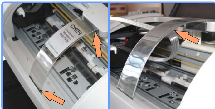
Установка полочки-подвеса С43

Закрепите полочку подвеса шлейфа, как показано на фото и переместив каретку, в крайнее левое положение, проложите в клипсу снизу полочки шлейф.