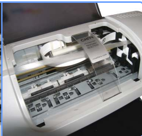
Прокладка шлейфа C43