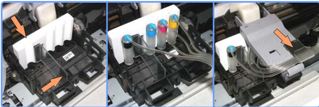
Установка планки с чипами и капсул CX3200

Шлейф не должен мешать прижимной крышке в закрытом состоянии.