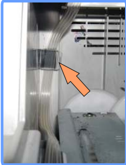
Прокладка шлейфа CX3200

Приклейте клипсу-держатель изнутри на левую сторону принтера, проложите в неё шлейф. Вторую клипсу приклейте сверху и проведите в неё шлейф. Шлейф не должен перегибаться или натягиваться, он должен выходить небольшим изгибом, не мешая движению каретки.