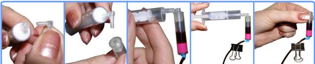
Заправка капсул и шлейфа CX3200

Отстыкуйте капсулу от шприца и наденьте капсулу на соответствующий чернильный штуцер печатающей головки принтера. После этого можно освободить зажим.