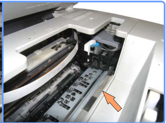
Прокладка шлейфа CX3200

Заправьте Ваши ёмкости, воспользовавшись инструкцией по заправке ёмкостей, и приступайте к заправке системы.